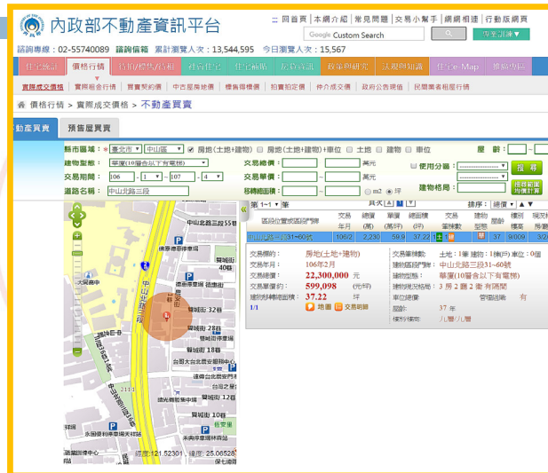
大同大學保護智慧財產權小組

內政部實價登錄網站，配合行政院 Open Data 政策，於104年7月1日起開放自該日以後資料無限期免費下載